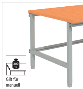
Gilt für manuell

Tischgestell manuell höhenverstellbar über Verschraubung im Höhenraster von 20 mm. Nivellierfüße mit 20-mm-Einstellbereich. 720 mm bis 1020 mm