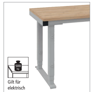
Gilt für elektrisch

Tischgestell manuell höhenverstellbar über Verschraubung im Höhenraster von 20 mm. Nivellierfüße mit 20-mm-Einstellbereich. 720 mm bis 1020 mm