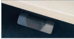
Höhenverstellung, Wipp-Handtaster inklusive Memoryfunktion